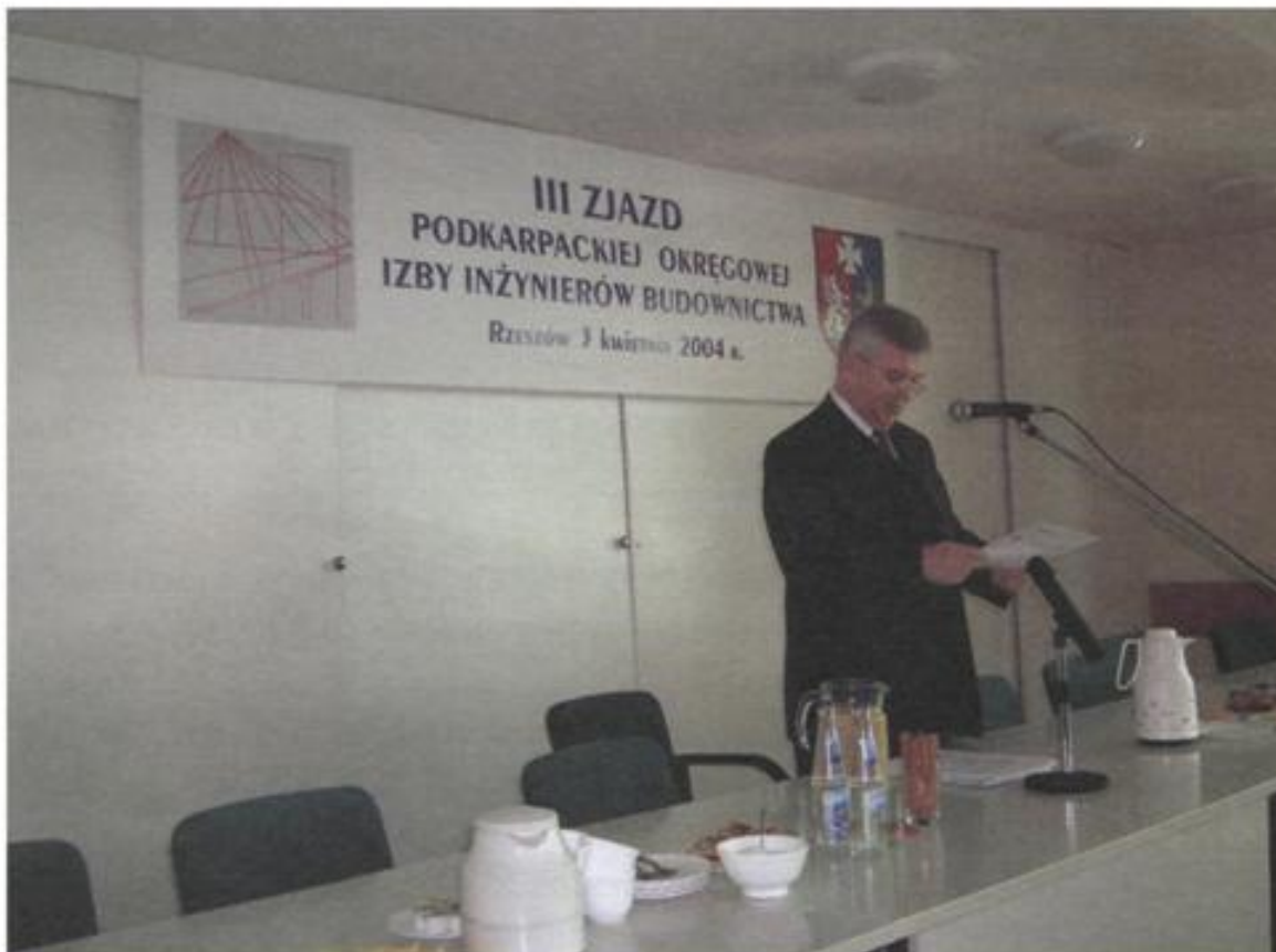
Przewodniczący obrad Zjazdu

Radzie Krajowej do rozpatrzenia, a ta orzekła, że w chwili obecnej jest niezasadny,