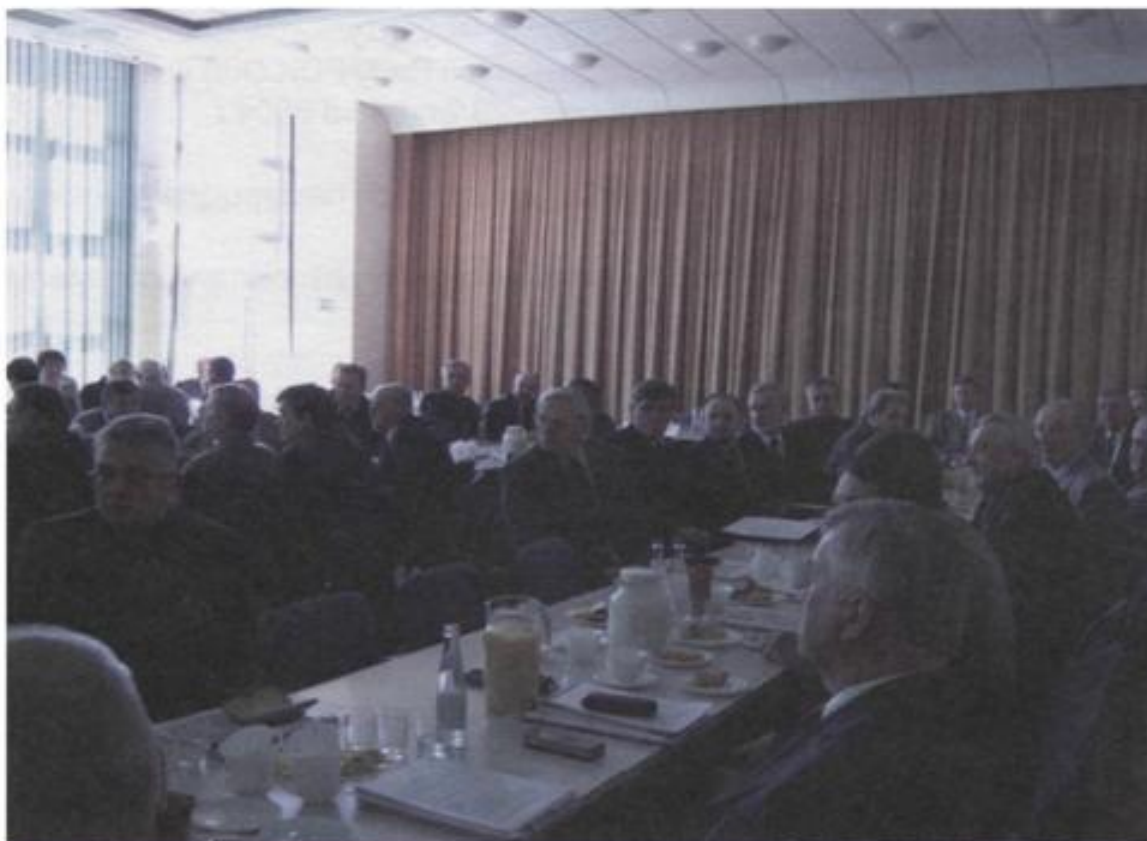
Z sali obrad