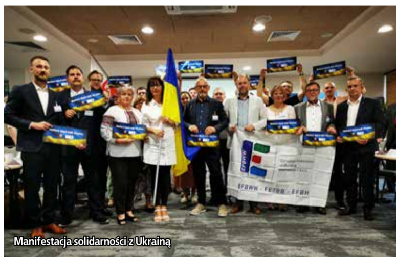
Manifestacja solidarności z Ukrainą