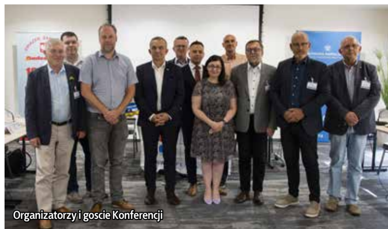
Organizatorzy i goście Konferencji

krajów przyjmujących największą liczbę pracowników delegowanych z krajów trzecich w budownictwie. (...) Od 24 lutego znajdujemy się jednocześnie w innej rzeczywistości w obszarze polityki, gospodarki i rynku