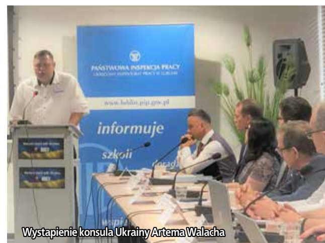
Wystąpienie konsula Ukrainy Artema Walacha