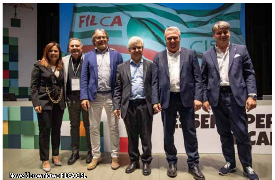
Nowe kierownictwo FILCA CISL