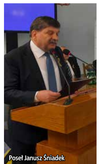
Poseł Janusz Śniadek

inwestycyjnego w budownictwie Niezbędne jest eliminowanie tych elementów struktury zarządzania i organizacji pracy, które bezspornie mają negatywny wpływ na poziom bezpieczeństwa pracy. Trzeba odejść od nieograniczonej i