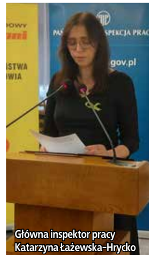
Główna inspektor pracy Katarzyna Łażewska-Hrycko

migrujących do Polski. To jest i będzie bardzo duża i rosnąca grupa pracowników budownictwa. Związek Zawodowy „Budowlani” podkreśla konieczność prowadzenia szerokiej, systemowej akcji szkoleniowej i edukacyjnej w zakresie bhp wśród pracowników migracyjnych, także w językach narodowych podstawowych grup tych pracowników. Ich poziom wykształcenia w tym zakresie musi być