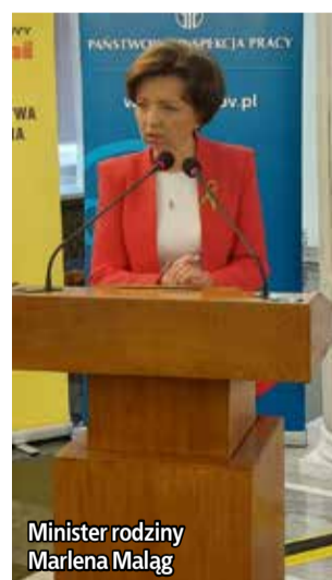
Minister rodziny Marlena Małag

pracowników podejmujących pracę w budownictwie wymagają zmian w systemie ochrony zdrowia. Jed-