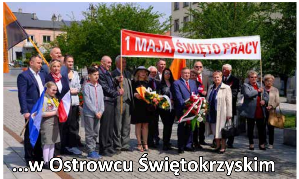
...w Ostrowcu Świętokrzyskim

ZZ „Budowlani” w Spółdzielni Mieszkaniowej „Hutnik” w Ostrowcu Świętokrzyskim zaznaczył swoją obecność na obchodach Międzynarodowego Dnia Solidarności Ludzi Pracy. Zauważalnym jest, że pandemia sprawiła, iż obchody Święta Pracy są w coraz skromniejszej odsłonie. W tym roku nie odbył się tradycyjny pochód ulicami miasta, a jedynie złożenie wiązań kwiatów w samo południe pod pomnikiem na Rynku Ostrowieckim.